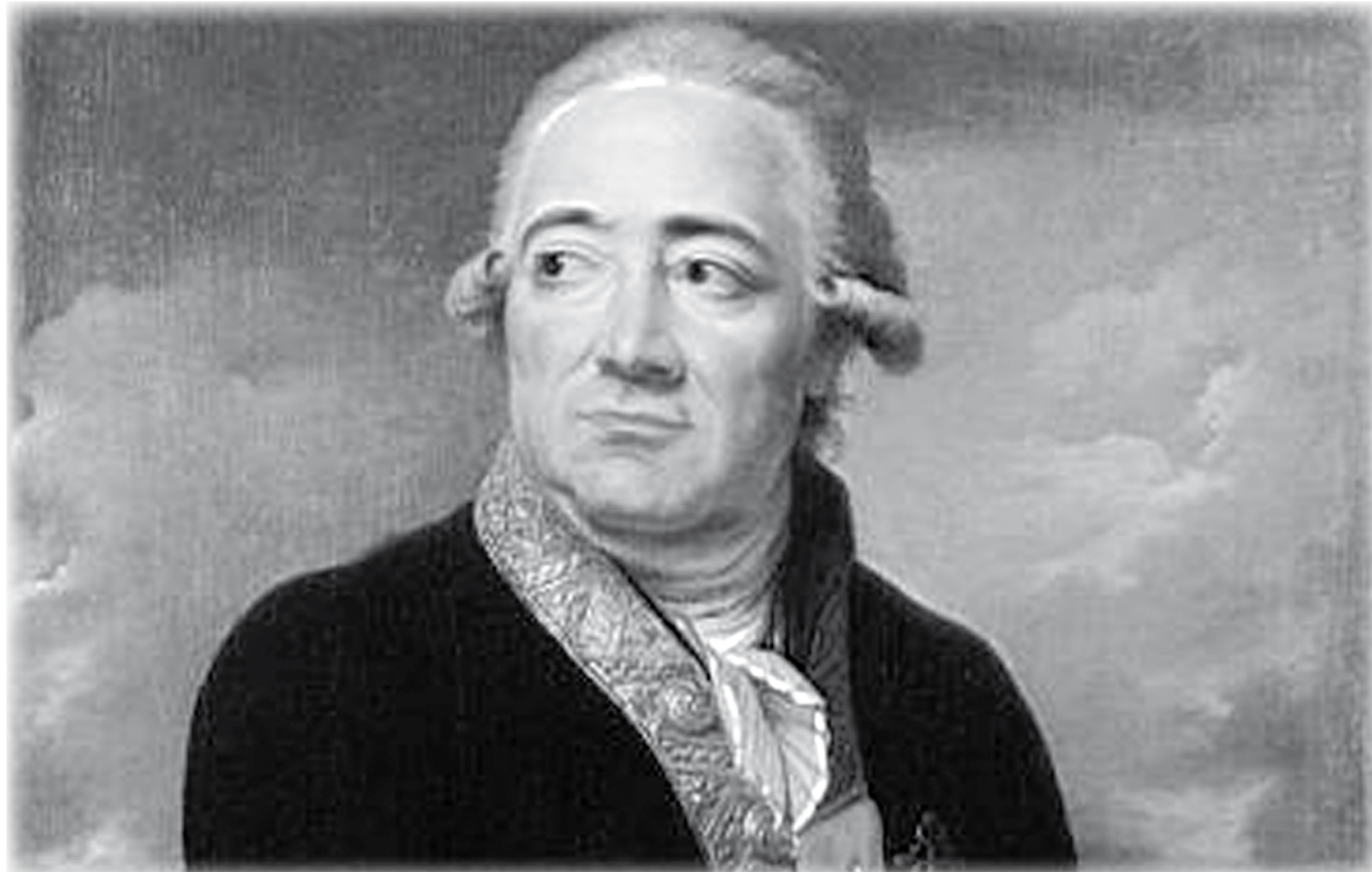
(2) Mendizabalen izen-abizenak = Juan Alvarez Mendez izan ziran, 1.790an Kadizen jaiokoa. (3) Guda yaurlaria = gobierno militar.

1.813an Azaroaren 11n, Napoleonen gudalozteak porrokaldi gogorra artuta, Napoleonek Balanzaien elkargo bidez ziñatu bear izan eban